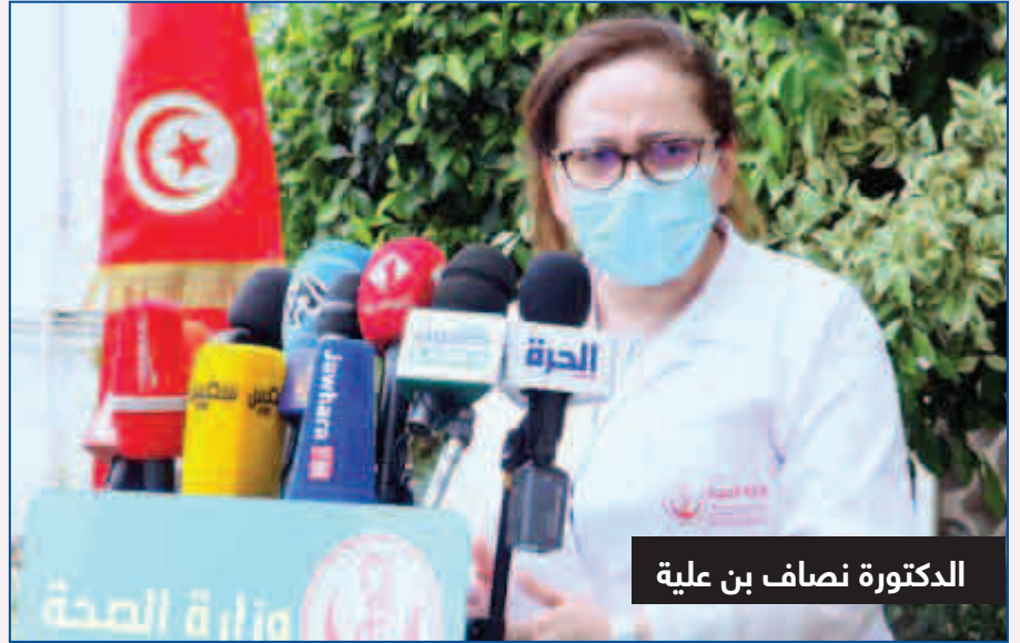
الدكتورة نصاف بن علي

التسلسل الجيني لفيروس كوفيد 19 تونس. وهو إنجاز علمي يحسب لها ولفريقها لما له من دور هام في التصدي للفيروس ومجابهته بشكل أنجع والقيام بالتقصي الصحيح والسريع عنه وبالتالي إتاحة فرص صنع لقاح مضاد له. وقد أوضحت في تصريحات إعلامية عديدة «أن تونس تولت نشر النتائج الأولية للبحث ما مكن تونس من التواجد مع بقية الدول في العالم مثل أمريكا والصين وكندا في مجال البحوث حول الفيروس».