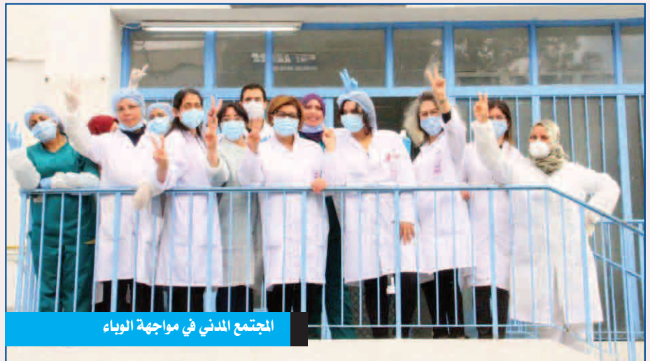
الاجتمع المدني في مواجهة الوباء

القطاع الصحي تكاد تكون مفقودة. ومن ضمن البيانات المتوفرة، تلك التي وردت في التقرير الاقتصادي العربي 2018 لصندوق النقد العربي والذي بين أن عدد المرضيات لكل 100 ألف ساكن يبلغ 660 في ليبيا، و618 في قطر، و587 في الكويت و540 في السعودية و568 في الإمارات و521 في البحرين و465 في عمان. وهي تبلغ أيضا 105 في الأردن، و388 في تونس و244 في الجزائر و198 في سوريا و178 في العراق و291 في فلسطين و91 في المغرب و73 في اليمن و70 في موريتانيا، وتصل إلى أدنى مستوياتها في الصومال (8). وتبلغ نسبة النساء الطبيبات 20 بالمائة في الأردن و39