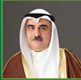
معالي وزير العمل المهندس عادل محمد فقيه