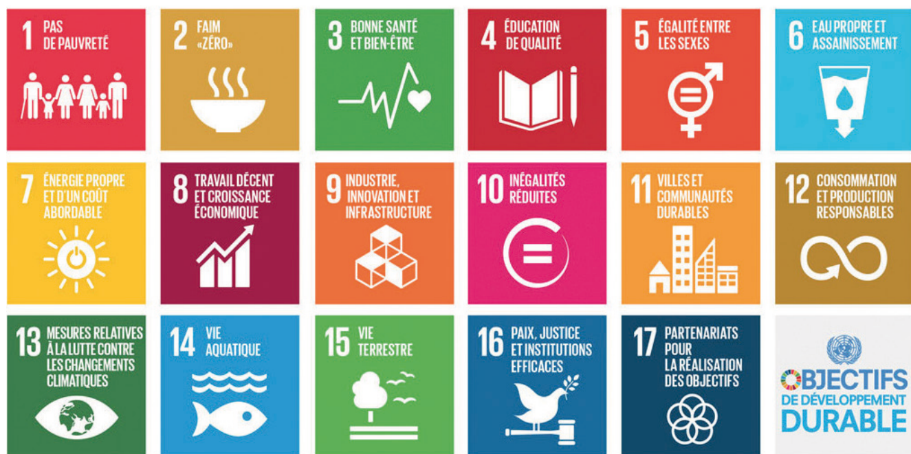
Figure 1. Les Objectifs de Développement Durable