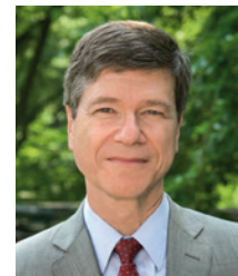
JEFFREY D. SACHS Directeur, Sustainable Development Solutions Network